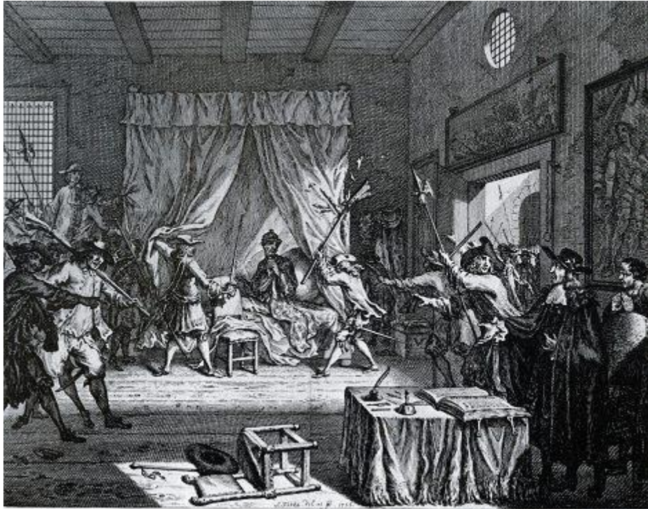
De kamer met de gebroeders de Witt wordt bestormd

Drank bleek een goed middel om de fanatiekste schutters over de drempel te krijgen. Toch bleven de schutters aarzelen. Zuylestein, Odijck en Tromp grepen hierop in. Zij lieten vijftien schutters bij zich komen en zeiden: "Mannen, 't gaet nu nae den avont, indien je iets goeds voor de Prince van Orange in 't sin hebt, 't is nu tijt.'